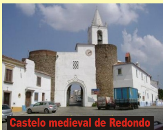
Castelo medieval de Redondo

Em hora a determinar, partida do nosso terminal em autocarro privativo com destino ao Alentejo. Chegada ao Hotel, distribuição dos alojamentos e continuação para a Vila de Redondo, onde faremos uma primeira paragem junto do velho Castelo Medieval , para visitarmos a ENOTECA e realizarmos uma prova de vinhos alentejanos. Continuação para o empreendimento " Terraços do Outeiro ", situado a 400m da Vila, nos terrenos da Quinta Outeiro do Franco, onde terá lugar o nosso Almoço/Convívio