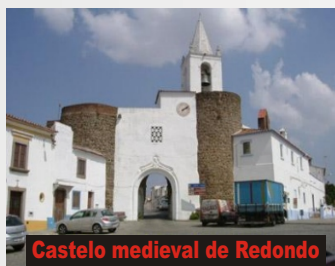
Castelo medieval de Redondo

Em hora a determinar, partida do nosso terminal em autocarro privativo com destino ao Alentejo. Chegada ao Hotel, distribuição dos alojamentos e continuação para a Vila de Redondo, onde faremos uma primeira paragem junto do velho Castelo Medieval , para visitarmos a ENOTECA e realizarmos uma prova de vinhos alentejanos. Continuação para o empreendimento " Terraços do Outeiro ", situado a 400m da Vila, nos terrenos da Quinta Outeiro do Franco, onde terá lugar o nosso Almoço/Convívio .